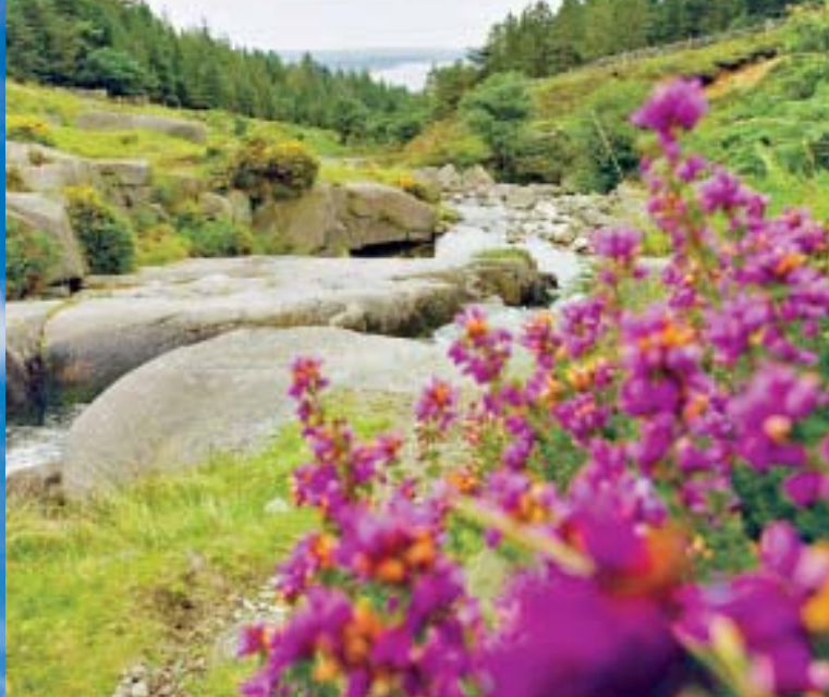
Alle Bilder dieses Folders sind urheberrechtlich geschützt.

Ausflug das malerische Landschaftsbild und eine seltene, teils subtropische Vegetation.